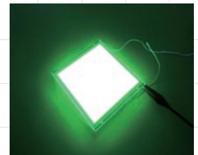
●「モイスターカット」を使用した有機EL照明

今回ご紹介する「有機デバイス用高バリア性封止材」は、まさにそうした最先端の有機デバイス市場における課題解決を目指した製品です。「機能性ポリマーによる樹脂成分の高機能化」、「特殊フィラーの高密度充填」、さらには基材との相互界面領域における密着性などにより、水分の透過をコントロールすることで、極めて低い水分透過率を実現します。実装評価でも優れた封止特性を示し、デバイスの長寿命化を叶える製品として注目されています。今後、このような画期的な製品が、エネルギーデバイスプロジェクトによって作り出され、新たなビジネスにつながっていくと考えています。