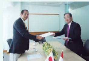
●インドネシア合併会社に関する調印式

インドネシアの経済が成長するとともに、今後、紙おむつ利用者もますます増え、当社のホットメルト接着剤に対するニーズが高まると予測し、9月26日、インドネシアにおいて接着剤製造会社を傘下に有するPT.Macrochema Pratama社と合併会社を設立することに合意しました。今後、現地でのホットメルト接着剤の生産を開始し、拡販に備えます。