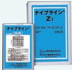
●冷熱媒体「ナイブライン」

当社千葉工場に隣接する自動車用成品メーカーのエチレンケミカル株式会社を9月1日付で連結子会社化しました。これまで冷熱媒体「ナイブライン」の製造を委託してきましたが、グループ化により連携が一層強化されます。また、エチレンケミカル社の設備や敷地を有効活用するなど、新たな展開を視野に入れています。