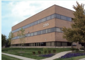
●デトロイト新オフィス(3F)

3月、アトランタに「MORESCO USA Inc.」の新オフィスを開設しました。これによりデトロイトの本社、ルイビルオフィスと合わせて、アメリカは3拠点体制となりました。アメリカだけでなく、メキシコ、南米・ブラジルまで広くカバーし、新市場開拓における万全の体制が整ったこととなります。